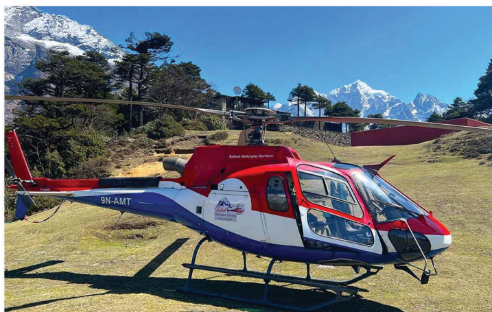
Tour en Helicóptero al Everest y las Himalayas