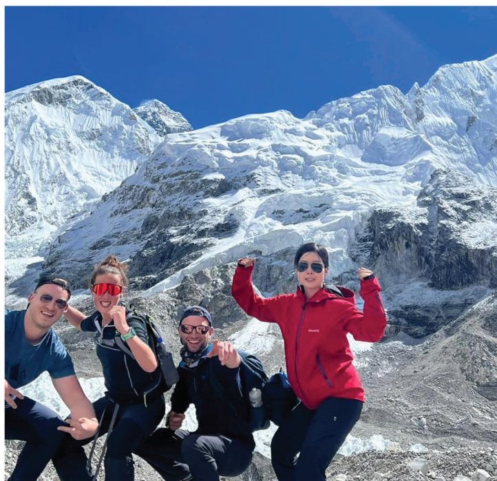
Senderismo / Trekking