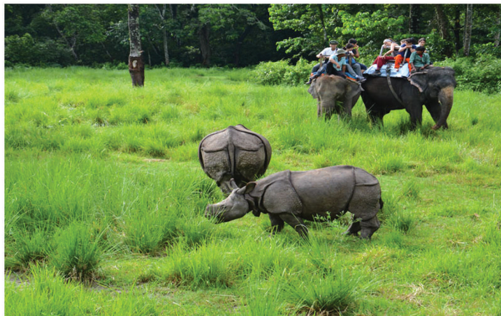
Safari de vida salvaje en Nepal