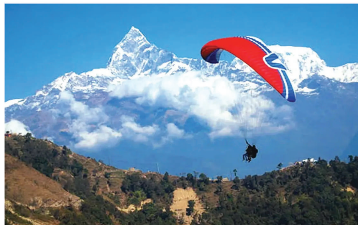
Actividades de Aventura