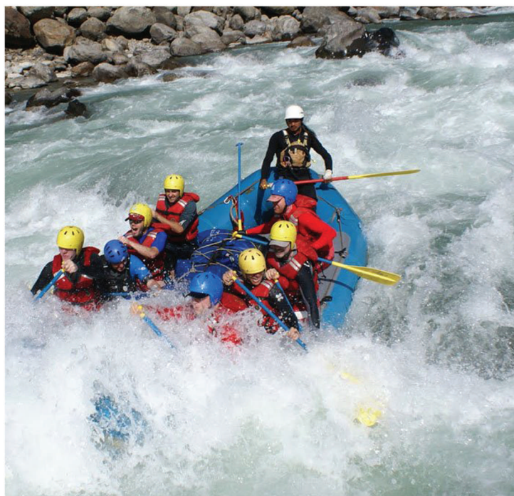
Rafting en aguas bravas